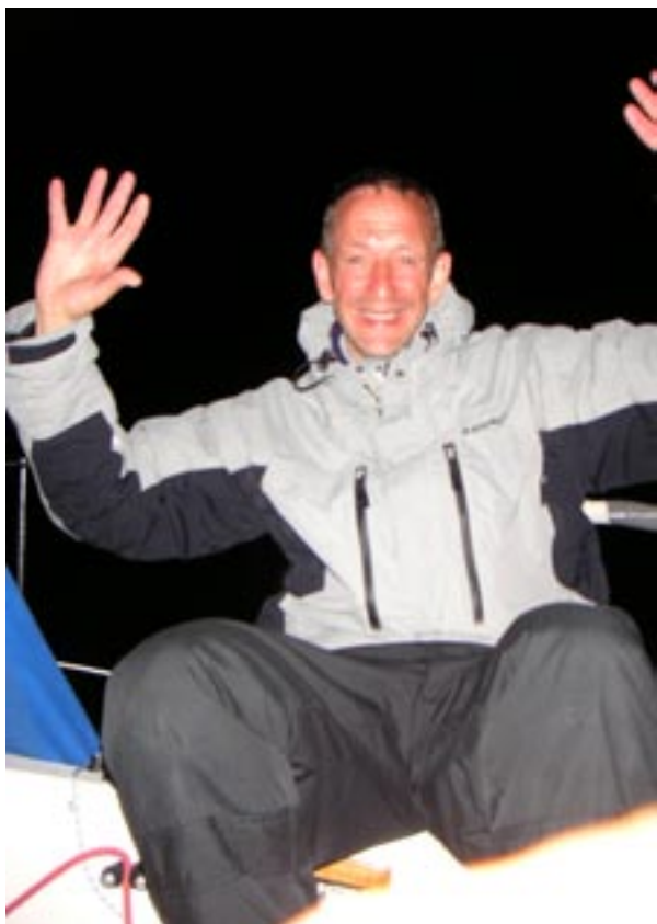
Skepparen efter ett glas rödvin

Hur som helst hade vi en kanonhäftig kväll och natt i vindstilla väder.