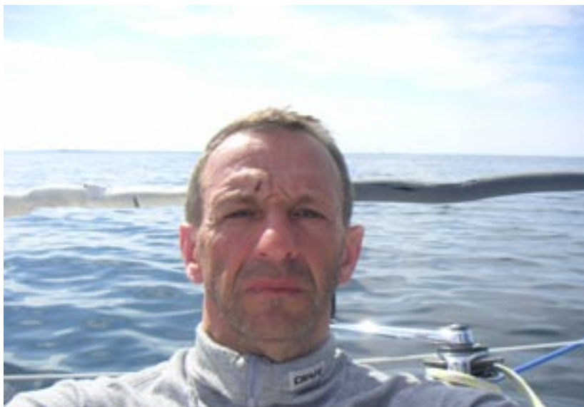
Trött och sliten seglare

På väg mot Klotet får vi trots allt en riktig vindrökare och "öket" axade på rätt bra. Vinden närmade sig 12 m/sek och det innebär att vi tvingas till ett försegelbyte. Tyvärr, kan man väl säga då ökningen kanske stod sig i 30-40 minuter. Vi hade tjänat på att kämpa ut den med fulla ställ, men man vet ju aldrig hur länge en vind står sig. Fort skall det gå med försegelbytet och det kan kosta på så att säga.